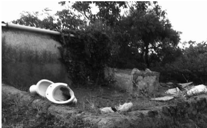
Uno degli scempi del territorio a monte, verso il Vesuvio

Pollena Trocchia - A lanciare l'allarme sono mamme disperate residenti nel centro storico di Pollena Trocchia. Facendo un salto indietro nella storia, Pollena era un luogo di villeggiatura per famiglie facoltose ed oggi? Cosa ne è sopravanzato del centro storico di cui era memore il Dio Apollo? Uno dei borghi più antichi e suggestivi dell'hinterland poco a poco una sorta di discarica abusiva. Colpa di chi? La colpa è anche e soprattutto degli stessi cittadini che deplorano, gli stessi che increduli guardano le strade del borgo e contribuiscono a rovinarlo non appena percorrono l'angolo. A risentirne, come in parecchi casi sono gli anziani che a fatica respira e, cosa respirano; non trascurando i bambini che percorrono queste strade decorate da spazzatura per raggiun-