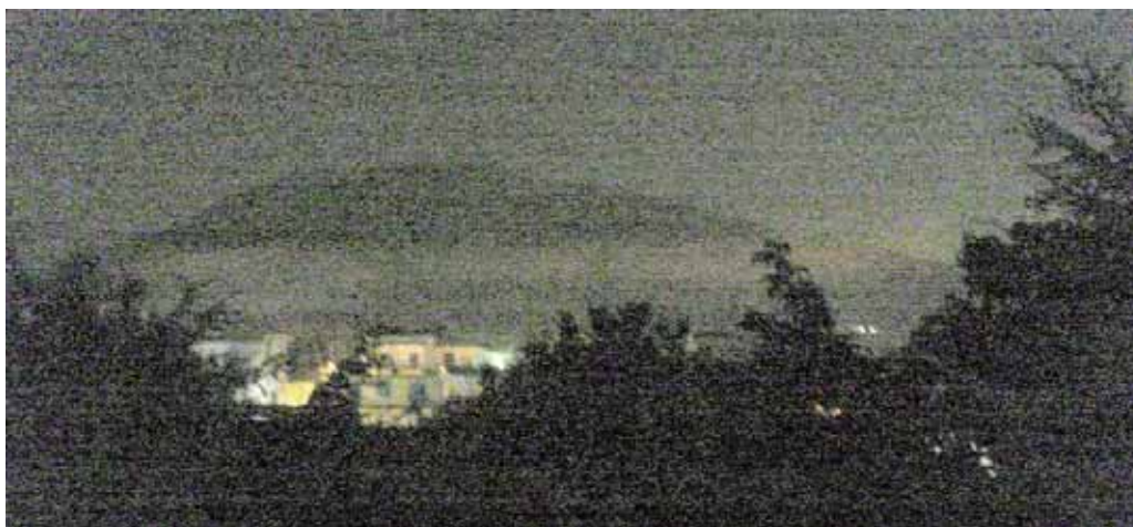
La strana nube all'alba che sveglia i cittadini sotto il Vesuvio