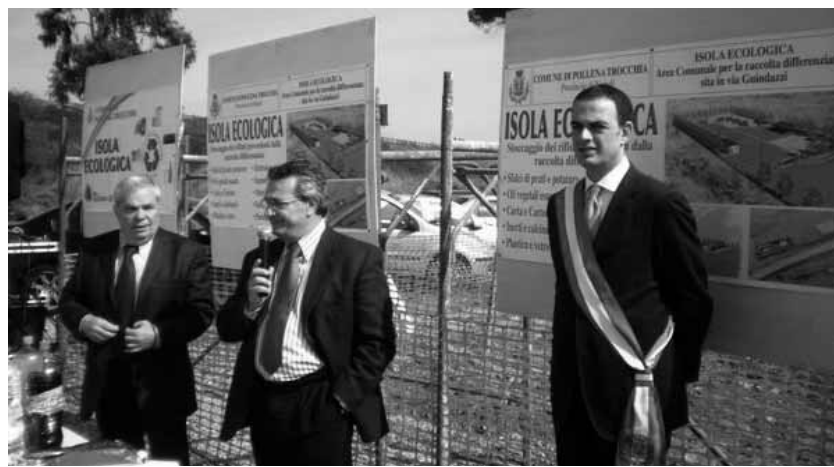
L'isola ecologica all'epoca dell'inaugurazione, sotto i 5 stelle

ta, cartone, vetro e ingombranti si aggiunge al servizio già presente del porta a porta. "Sorge quindi il dubbio - proseguono i cinquestelle - della convenienza economica nel pagare un servizio di porta a porta che si affianca a quello di un'isola ecologica per la quale si paga un'ulteriore ditta per le stesse tipologie di rifiuti. A questo si aggiunge l'inefficienza di alcuni servizi che risultano fermi negli appositi container senza che vi sia una convenzione o un'attività di smistamento e riutilizzo".