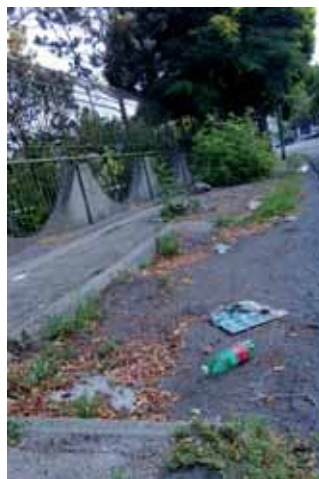
Scene di ordinario abbandono istituzionale