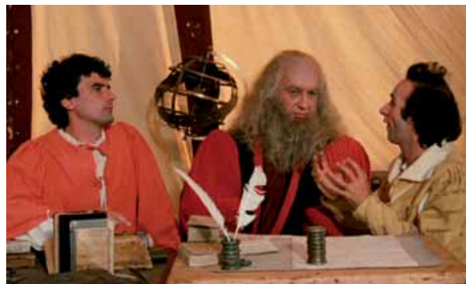
Povero Troisi, sotto una delle ultime (costosissime) edizioni