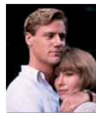
Gusto Patata svergognata