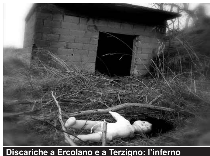
Discariche a Ercolano e a Terzigno: l'inferno

la splendida vista del golfo di Napoli; nel mezzo, l'inquietante discarica abusiva di Via Novella; tutt'intorno, coltivazioni di olive, pomodori, limoni, mele, (etc...) che ogni giorno producono i frutti, destinati alla vendita nei mercati ortofrutticoli della provincia di Napoli. A nulla sono servite le tante denunce, presentate agli organi di Polizia, e gli sterili cartelli di Divieto di Scarico, posti dal Comune di Ercolano. Enormi cumuli di spazzatura sembrano celare le bellezze naturali del territorio. Il nero dei rifiuti ha, ormai, quasi definitivamente