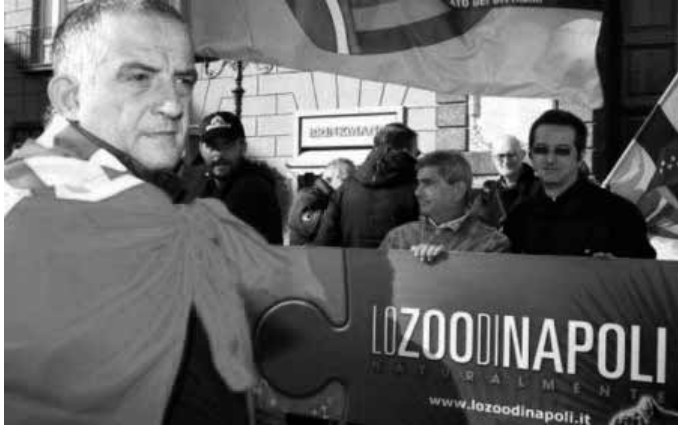
I dipendenti dello zoo di Napoli in agitazione

Il futuro dell'Edenlandia e del Parco Zoo di Napoli sembra ancora incerto. Il 25 gennaio scorso il consiglio di amministrazione dell'ente Mostra aveva raggiunto un accordo sulla proposta avanzata dalla società Clear Leisure che avrebbe dovuto rilevare lo Zoo, il parco dei