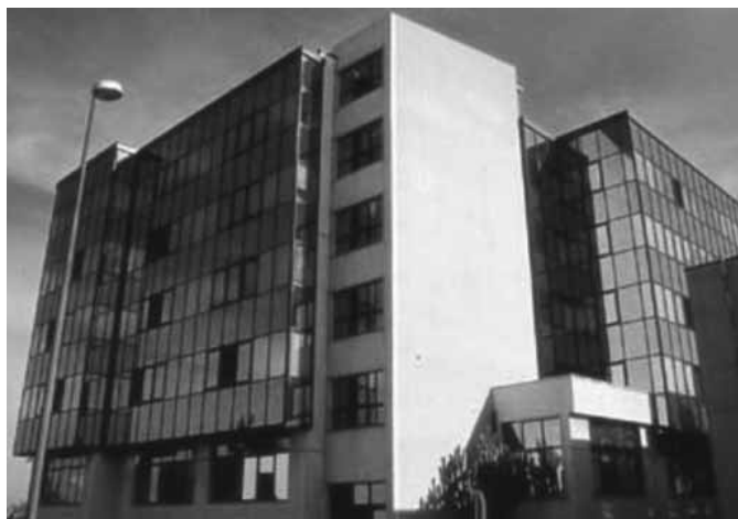
Il Municipio di Portici, più volte finito nella bufera