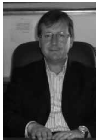
Il sindaco Guadagno e l'assessore Pipolo

Volla - E' durata poco più di un minuto l'apertura dell'ultima seduta del consiglio comunale, quando d'improvviso quattro disoccupati, cittadini di Volla, hanno fatto irruzione nell'aula, indirizzandosi in malo modo e con gesti provocatori all'assessore Gianluca Pipolo ed al Primo Cittadino Angelo Guadagno, causa: una lunga disoccupazione. I quattro personaggi, già noti alle cronache locali per le numerose volte in cui hanno tentato il suicidio ed hanno assalito il Municipio hanno inveito contro sindaco e assessori perché da tempo hanno perso il lavoro. L'agitazione è forte all'interno dell'aula, a tal punto, che visti i dissensi e la pressione delle forze dell'ordine, Polizia Municipale e Carabinieri, i quali invitava-