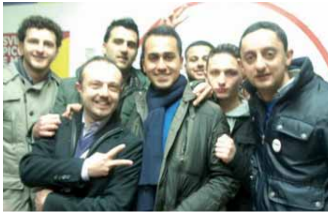
I Grillini in Parlamento e Luigi di Maio, il "Beppe Grillo" sotto il Vesuvio

proposto Roberto Fico alla Camera, che era in lizza insieme ad altri 4 candidati, ma poi abbiamo deciso che era più giusto eleggere una donna. I senatori hanno votato subito in grandissima parte Crimi. Abbiamo deciso di comunicare attraverso l'avanzatissima strumentazione di e-government che ci è stata messa a disposizione dal Parlamento. In questi giorni i nostri tecnici sono andati a chiedere all'ufficio preposto che si è "illuminato" quando abbiamo detto di voler usare attivamente le tecnologie che ci mettono a disposizione. Come avete discusso il tema della Fiducia ad un eventuale governo Bersani? Alcuni, due o tre, era-