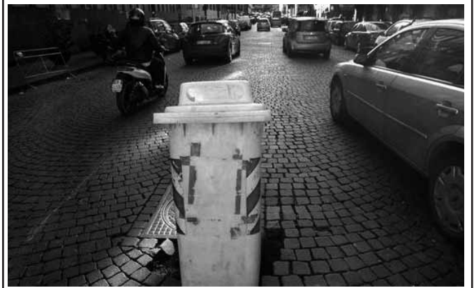
Scene di ordinaria quotidianità a Via Marina (Napoli)

Sembra di stare a Bagdad, dopo un bombardamento: è questo lo scenario che appare quotidianamente su una delle strade principali di Napoli: ogni giorno lungo Via Marina in media si rompono gli ammortizzatori di un centinaio di automobili e cadono altrettanti guidatori di scooter nelle innumerevoli e oramai profondissime buche spesso facendosi molto male anche perché saltano continuamente dalla carreggiata i sanpietrini. La cosa assurda è