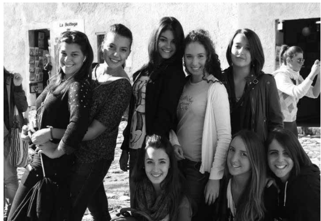
Studenti e guide al SUor Orsola Benincasa

Anche quest' anno l' Università degli studi Suor Orsola Benincasa di Napoli è tra i grandi protagonisti del Maggio dei Monumenti napoletano. Proposta dall' Associazione culturale "Locus iste" è uno di quegli itinerari che si pone come un vero e proprio strumento di disvelamento di ciò che normalmente viene celato, aprendo alla vista e al cuore dei visitatori frammenti di storia a volte inimmaginabili. "Orsola una Santa viva" è il nome della visita teatralizzata che apre le porte al pubblico per disvelare il proprio patri-