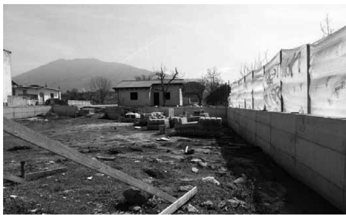
La villetta a Musci: stop and go per il Forum Giovani

Dopo otto mesi di stop, riprendono i lavori della villa comunale di via Calabrese. Era settembre quando le ruspe hanno smesso di scavare in zona Musci. Il motivo: un'interdittiva antimafia all'impresa aggiudicataria dei lavori. Si tratta della CO.GE.MA.