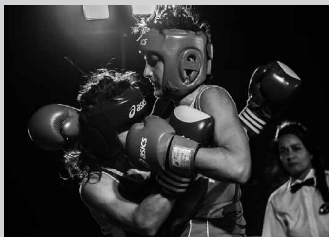
Le campionesse all'evento targato Praticò

sono stati gli Italiani Junior nel 2005, questo è il secondo riconoscimento consegnatomi - continua - è sbagliato vedere il pugilato come violenza, è uno sport, come tutti gli altri, competitivo, finalizzato alla vittoria, ma pur sempre uno sport pulito - conclude - la mia prossima tappa saranno i Campionati universitari di pugilato a Cassino". A gestire i giochi Peppe Accardo. Momento emozionante l'applauso calo-