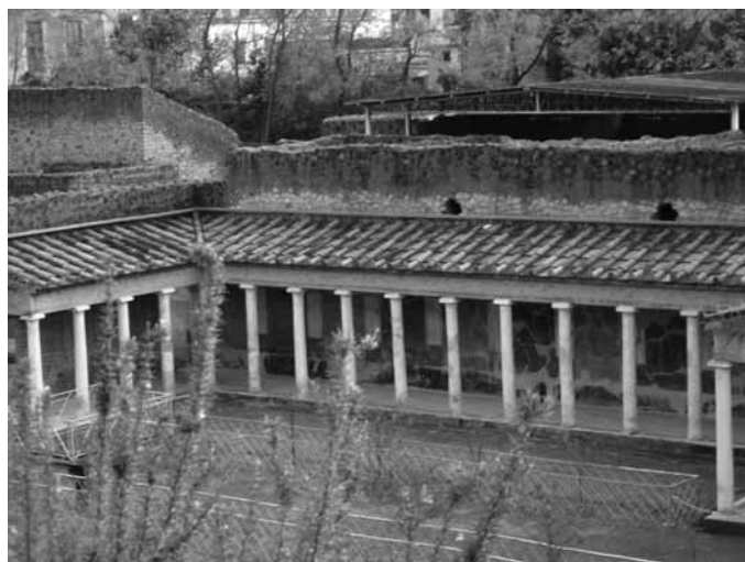
C'è un Vesuvio abbandonato da rilanciare

Poppea, la concubina diventata seconda moglie di Nerone, era celebre per i suoi bagni nel latte d'asina. Li faceva, oltre che a Roma, nella piscina della villa di Oplontis, che si era fatta costruire come villa di otium, con lo sguardo perso a mirare l'orizzonte e il golfo. Oggi la vista del mare è ostacolata dalla presenza di un orrendo palazzone di 10 piani, frutto della speculazione edilizia degli anni Ottanta. Eppure, la villa di Poppea, con i suoi splendidi affreschi e le sue sale maestose, è un fiore nel deserto che sorge all'interno di una città difficile, Torre Annunziata. Un'oasi che da sola potrebbe riscattare la città dal marchio infamante di "terra di camorra", così brutalmente massacrata e resa cieca alle sue bellezze. Portata alla luce negli anni Sessanta, la villa, risalente