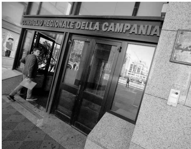
La sede del consiglio regionale e, sotto, Stefano Caldoro

Napoli - La notizia è di quelle che fanno tremare le vene e i polsi: 57 consiglieri regionali campani indagati per presunto peculato. Dopo le assemblee regionali della Lombardia e del Lazio anche quella della Campania finisce sotto la lente della magistratura. I 57 rappresentanti dell'Assemblea regionale sono indagati nell'ambito dell'inchiesta sul presunto uso improprio dei fondi a disposizione dei gruppi consiliari. Nei primi giorni di interrogatorio agli indagati sono stati chiesti chiarimenti sull'uso delle somme percepite, che venivano corrisposte sotto la voce "funzionamento dei gruppi"