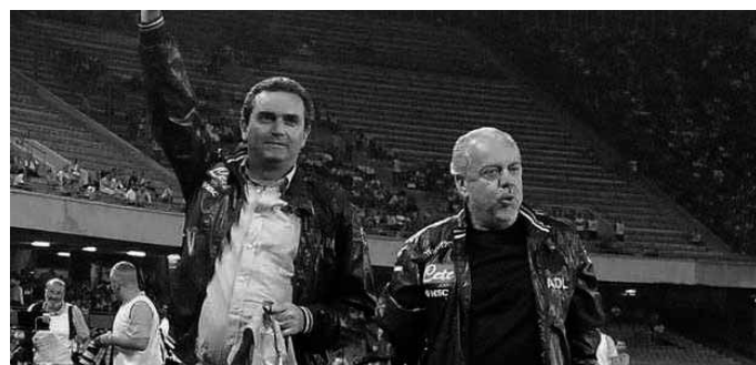
Il Sindaco de Magistris e il presidente De Laurentis