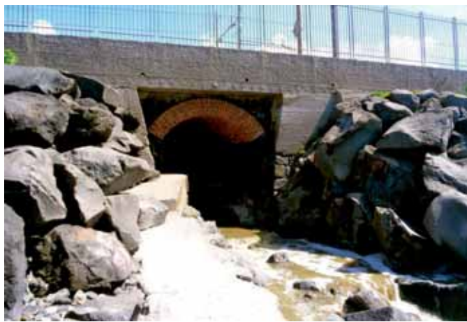
Immagini delle condotte fognarie che danno a mare

que, abbia riscontrato valori battereologici oltre il limite. Quanto basta, dunque, per sancire il divieto di balneazione nel lido, tornato appena due anni fa balneabile dopo oltre 30anni di divieti. Ad influire sul cattivo stato delle acque del Granatello, pare siano stati gli sversamenti illeciti di Ercolano. A via Marittima, a poche centinaia di metri dal molo borbonico porticese, infatti, due condutture fognarie, poste a 100 metri di distanza l'una dall'altra, hanno ridotto il lito-