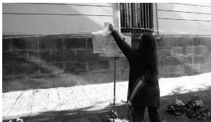
La bimba che inaugurerà la targa del Giardino delle donne

Sant'Anastasia - Distrutta la targa del "Giardino delle Donne d'Italia". A distanza di un anno, è il secondo atto vandalico compiuto verso l'aiuola di Piazza Siano, che già a giugno 2012 fu danneggiata e furono anche sottratte quattro piantine. Questa volta è stata presa di mira la targa commemorativa, fatta a pezzi, probabilmente da un gruppo di ragazzi. Come si ricorderà, il roseto è stato inaugurato il 12 novembre 2011 e realizzato con piante della nuova varietà di rose "Donne D'Italia 150 anni", prodotta dall'ibridatore di San Remo, Antonio Marchese. Il "Giardino delle Donne d'Italia" è un monumento alla memoria delle donne che hanno fatto l'Italia e venne realizzato anche quale monito contro la violenza sulle donne. Sant'Anastasia, con la collaborazione di Annamaria Barbato Ricci, si pose come città pilota contagiando altri Comuni d'Italia in questa iniziativa. "Da Presi-