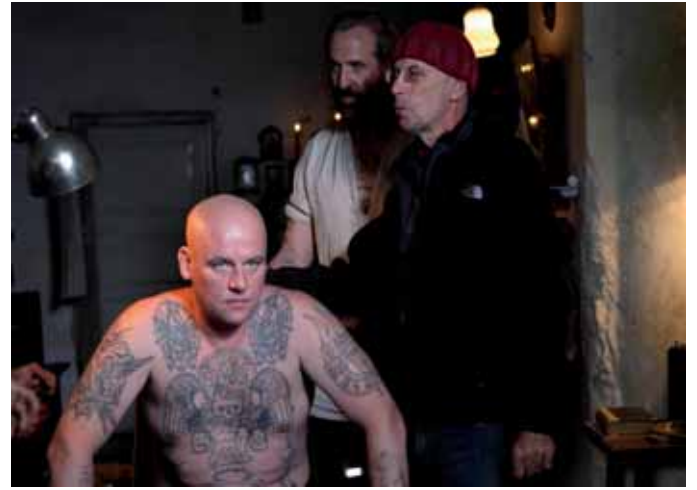
Cinema d'autore sotto le stelle del Vesuvio

contri con staff, registi ed addetti ai lavori. Il mese di luglio verrà chiuso da Spielberg ed il suo "Lincoln" (lunedì 22), "Quello che so sull'amore" di Gabriele Muccino (23 e 24) ed il fantasy di Peter Jackson, "Lo Hobbit" (25 e 26). Il programma di agosto sarà disponibile al sito www.arcimovie.it Non da meno l'appuntamento all'ombra della Reggia con la ventesima edizione di "Fresko Film". Stessi orari e uguali costi per gli spettacoli che andranno in scena Portici, al secondo Circolo Didattico di viale