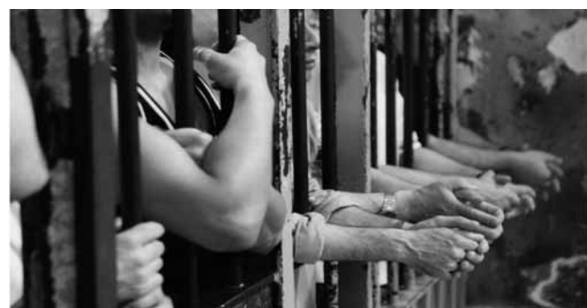
Diritti e pene, donne e uomini per la dignità

Portici - "Non possiamo gettare le chiavi delle carceri". Una frase che assume un particolare significato se a pronunciarla è Rita Borsellino, sorella di Paolo, intervenuta presso la Reggia di Portici, in occasione della presentazione del libro "Diritto Penitenziario e Dignità Umana". Secondo la sorella del giudice ucciso da "cosa nostra", il fatto che in carcere ci siano persone che sbagliano non autorizza a gettare le chiavi delle celle, è necessario comprendere e capire cosa c'è all'origine del disagio Sociale. "E' indispensabile entrare nel vissuto di ogni persona - sottolinea Leandro Limoccia, avvocato, autore del libro con la collaborazione di Giancarlo Caselli e ricercatore del Dipartimento di scienze Politiche Jean Monnet - Il concetto di Capienza, al centro del dibattito politico di questi giorni, è un concetto legato alla Pietà umana nel senso più nobile del termine, e alla possibilità sociale e psicologica da parte dell'individuo di accogliere e dare spazio."