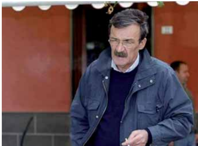
In vita, morte e miracoli di Nicola Pugliese

preferì il calore familiare ai salotti letterari, tanto da attendere trentuno anni prima di scrivere la sua seconda opera 'L a nave nera'. Il libro è la cronaca sanguigna e fantastica di quattro giorni di pioggia a Napoli. A Napoli piove. Una pioggia forte e continua inaspettata, che dapprima pulisce le strade, lava via la polvere accumulata sui palazzi, sui semafori, sulle piante dopo una lunga estate e che però poi non decresce, continua a cadere e a cadere ancora, come cadrà il palazzo di via Tasso, portandosi via un'intera famiglia o come le vite cadute nella voragine che si è aperta sotto i loro piedi in via Aniello Falcone. Ma sotto quest'acqua che scende e porta via cose e persone non c'è solo