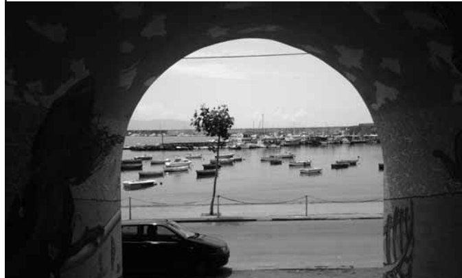
I mirales che colorano il mare...

Un arcobaleno di colori per combattere il degrado. È questo lo spirito dello JA! Jazz Art Festival, l'iniziativa promossa dai giovani di Torre Annunziata per dare un volto nuovo al centro storico della città. Numerosi writers si sono dati appuntamento, a ritmo di musica, per decorare di murali le rampe