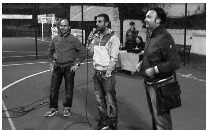
Gli organizzatori e la squadra vincitrice del torneo 2012

Imma Solimeno redazione@loravesuviana.it