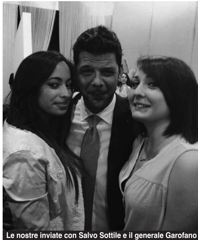
Le nostre inviate con Salvo Sottile e il generale Garofano

televisivo. Col tempo crebbe sempre più la mia ammirazione e stima verso la trasmissione e verso Sottile. Per anni ho provato ad entrare in quel contesto, come pubblico, per capirne le dinamiche, osservare i retroscena, studiarne la scaletta e i fuori onda. Fino a quando la settimana scorsa una chiamata di una persona che lavora in produzione mi invita a seguire in studio la messa in onda. Un'emozione unica. Un sogno coronato. Chiesi subito alla mia collega ed amica Mar-