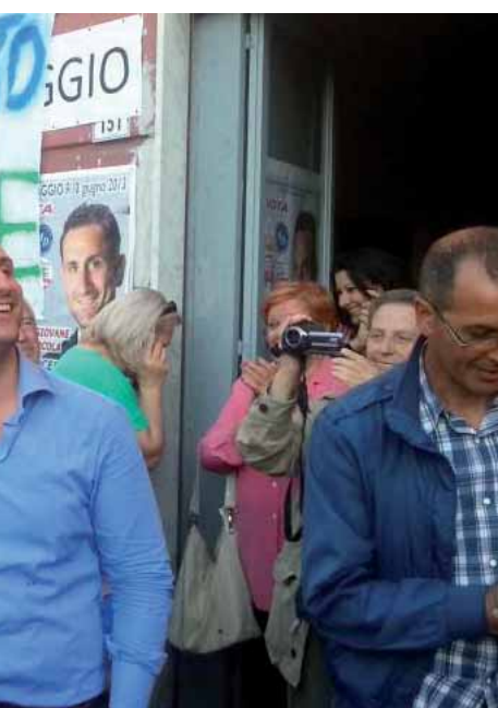
nuto dai vecchi politici e dai giovani

stenuto la buona politica è frutto di un lavoro collettivo fatto di serietà e passione - aggiunge - la priorità imminen-