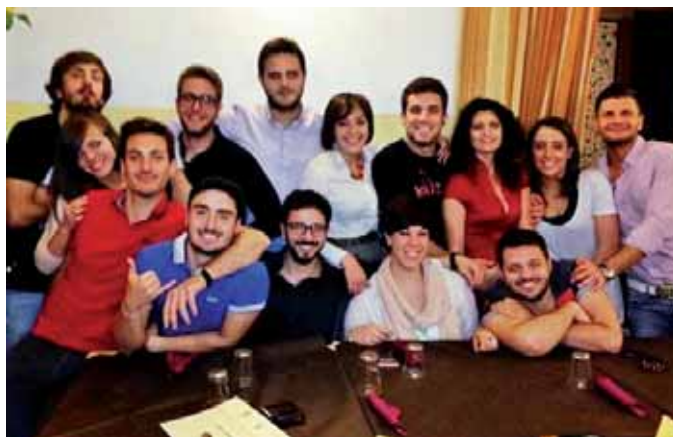
Il gruppo di Cremano Giovani e "47 il morto che parla" il fumetto horror alle vongole

di persone ostinate a sopravvivere, con ogni mezzo, in un clima di puro terrore. Nonostante l'analogia nella trama, l'intreccio del fumetto si sviluppa però in maniera molto diversa, attraverso una chiave di lettura chiaramente comica e ironica; basti pensare che i personaggi principali sono l'espressione della più bassa napoletanità popolare: le "vrenzole" e i "tamarri". "Abbiamo cercato di prendere la comicità napoletana e di inserirla in un contesto che non ha assolutamente niente a che fare con Napoli" spiega Andrea Errico, ideatore del progetto "al centro di tutto ci sono sei personaggi, tra cui tre popolane, con le loro peculiarità, la loro espressività inconfon-