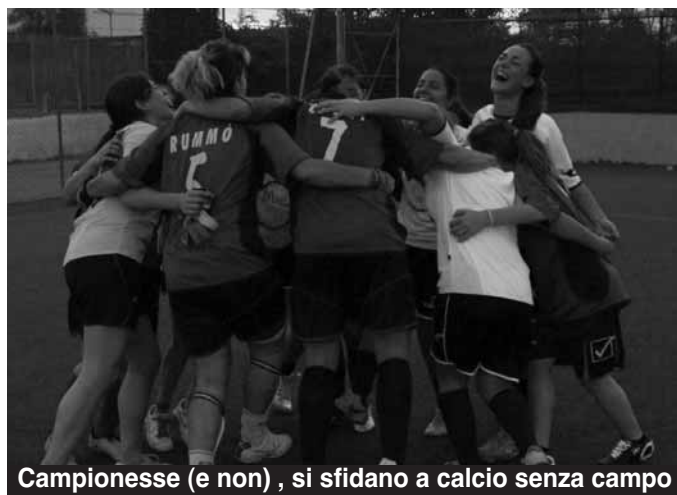
Campionesse (e non), si sfidano a calcio senza campo