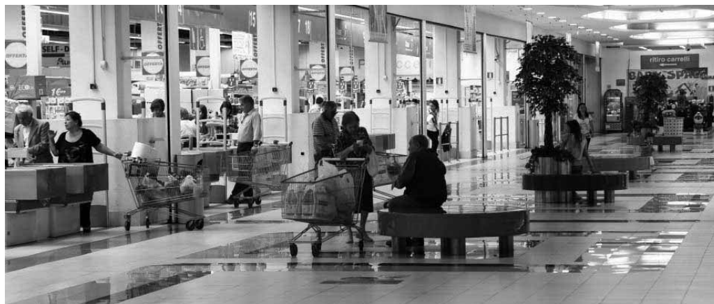
Auchan, rappresentava il successo della grossa distribuzione sotto il Vesuvio

punto vendita in relazione al territorio. Ma quale sarà il futuro per gli oltre 120 lavoratori, che da anni prestano servizio?. Un dato allarmante, che però non ha suscitato nessun tipo di attenzione, né mediatica, né tantomeno comunale, eppure è una grande realtà territoriale, che andrebbe salvaguardata, per non parlare delle povere vittime dell' accaduto che nella migliore