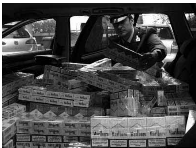
Agli angoli delle strade è tornato il "bancariello"

Tre tonnellate di sigarette di contrabbando marchiate "Classic", del valore di oltre 300mila euro, sono state sequestrate a Napoli dalla Guardia di Finanza: tre le persone arrestate e tre quelle denunciate. Le sigarette, di provenienza ucraina e di ottima qualità, erano custodite in un cassone coibentato parcheggiato all'interno di una vasta area adibita a parcheggio di automezzi pesanti di Casoria, in provincia di Napoli. Evasi tributari per oltre 400mila euro. Le sigarette sequestrate erano nella disponibilità di un contrabbandiere napoletano che conduceva l'attività insieme a suoi stretti pa-