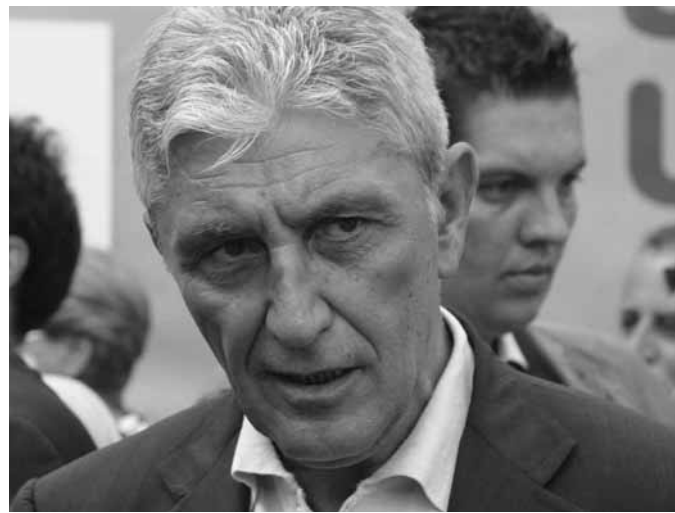
L'ex super Governatore Antonio Bassolino