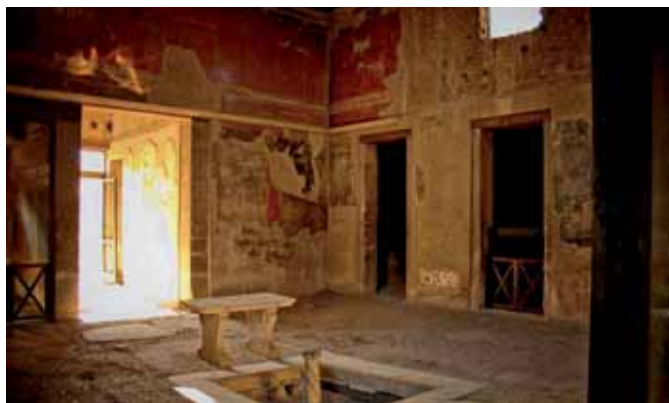
Ordinarie scene da Scavi, ma il turismo non decolla

no susseguite nei secoli con un solo comune denominatore: riportare alla luce i fasti di un'antica civiltà, sommersa dalle