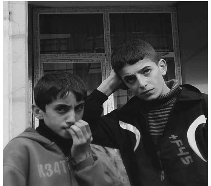
Scene di vita e di viaggio: al confine non solo politico

za che potessimo scattare fotografie, che immortalassero le condizioni di ghettizzazione subite dagli abitanti curdi del luogo. Ciononostante, non abbiamo avvertito il pericolo neanche per un momento: il merito va a quelle persone, turchi e