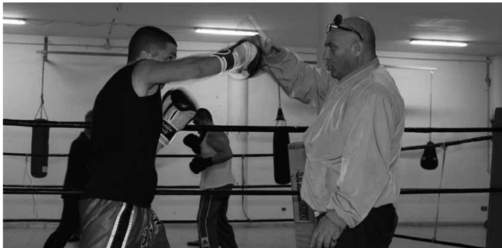
La strada, i cazzotti, i guantoni. I sogni e la periferia che diventa frontiera

Daniele De Somma redazione@loravesuviana.it