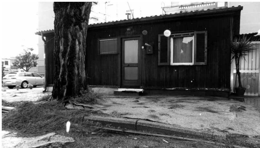
REWIND Si trona indietro negli anni a Portici: anni '80, era di containers

Portici - A distanza di 32 anni dal terremoto, che mise in ginocchio l'Irpinia, tredici famiglie porticesi continuano a vivere nei prefabbricati post-sisma di Via Scalea. Allestiti come alloggi provvisori per far fronte all'emergenza sisma, le abitazioni avrebbero dovuto ospitare le famiglie terremotate per un tempo massimo di 5 anni. Il degrado, che da anni vivono queste famiglie, è ben visibile, sin dal primo momento in cui si osserva il luogo, in cui sono costrette a vivere: sui marciapiedi scorrono le condutture dell'acqua potabile; i tetti sono ricoperti di eternit, materiale pericolosissimo, che rappresenta una vera e propria bomba ecologica; i prefabbricati appaiono, ormai, logorati dal tempo e dalle intemperie, e i fili