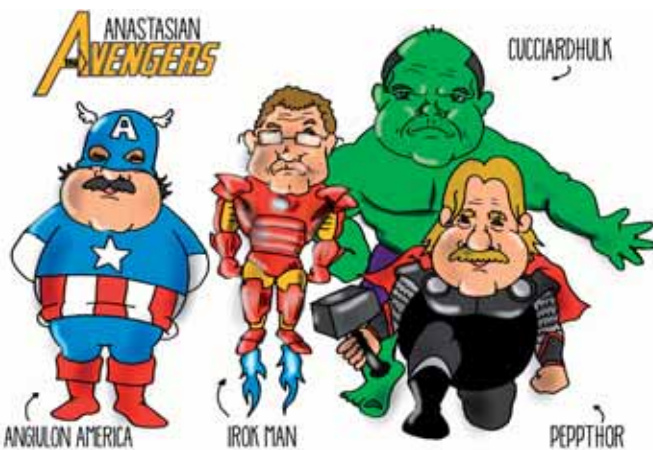
Alcune delle tavole del talento comix vesuviano