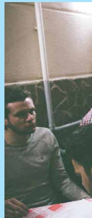
UN VIAGGIO NEL VIAGGIO: NAPOLI AC