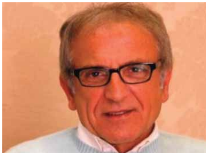
L'EX SINDACO CARMINE ESPOSITO, TRA I PIÙ SEGUITI SUI SOCIAL NETWORK