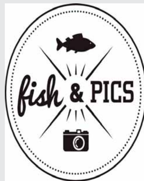
AGLIANICI E FIANI OTTIMI E DAL PREZZO GIUSTO

Parafasando il "fish&chips", celebre piatto della cucina d'oltremarica, Spazio Tangram - Napoli ha creato Fish&Pics, ciclo di dodici serate in cui si uniranno l'enogastronomia e la fotografia, con la "qualità" come minimo comune denominatore. L'osteria vineria "Baccalaria", che a breve aprirà a Piazzetta di Porto 4, a Napoli, metterà il cibo (Sua maestà il baccalà, ma non solo) mentre Spazio Tangram metterà le fotografie. Questi i dodici temi su Napoli che andranno a comporre il ciclo di serate fotografiche "Fish&Pics" al Baccalaria a partire da martedì 29 aprile. Temi e testi sono a cura di Sergio Gradogna.