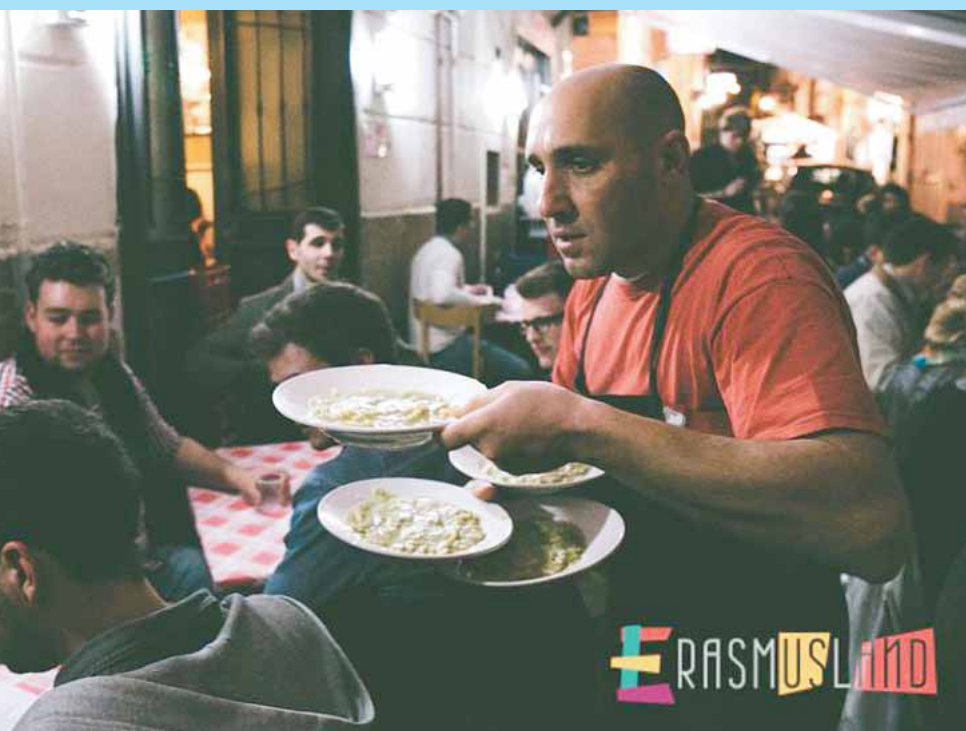
COGLIE GLI "STRANIERI" DELL'ERASMUS TRA I VICOLI E IL RAGÙ DOMENICALE

l'autobus, il nostro traffico, non fa affatto piacere finir derubato tra l'Anticaglia e i Tribunali o nella Pignasecca all'uscita della "casa della Trippa di Fiorenzano", o dall'imbocco dei quartieri, dove gli Erasmus si incontrano una volta a settimana per mangiar la pasta e patate di Nennella. E poi ci son le denunce spesso non ascoltate, perché magari non conviene a nessuno a risolvere il problema delle case fittate agli studenti senza regolari contratti, per cui senza un briciolo di ricevuta che tra l'altro spesso serve a farsi rimborsare le diarie quando le università gemellate lo prevedono. Anche l'Università Suor Orsola Benin-