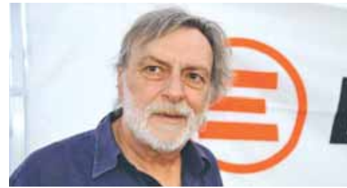
GINO STRADA, MEDICO IN FRONTIERA A PONTICELLI

Il 19 Febbraio nella cittadina vesuviana non è un giorno come un altro, ma il giorno in cui "è nata una stella". Ed è proprio così che è stata intitolata l'iniziativa che, ogni anno, intende mantenere sempre vivo il ricordo di Massimo Troisi nell'anniversario della sua nascita (19 febbraio 1953). La manifestazione è diventata negli anni un suggestivo momento di commemorazione, per mantenere viva la figura dell'artista presso le nuove generazioni e rinnovare la sua arte attraverso, incontri, testimonianze e proiezioni. La novità di quest'anno è il coinvolgimento delle scuole nel progetto: i bambini e i ragazzi di San Giorgio hanno ricordato Troisi con lettere, disegni, poe-