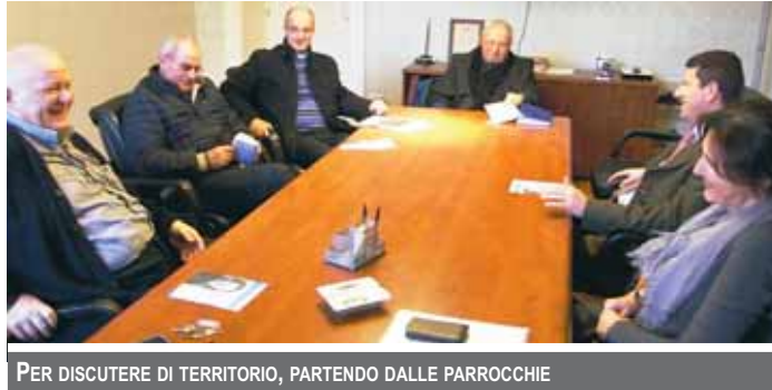
PER DISCUTERE DI TERRITORIO, PARTENDO DALLE PARROCCHIE