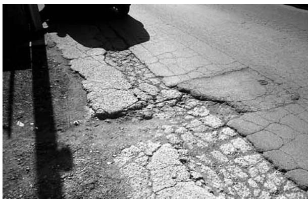
TRA POLLENA TROCCHIA E VOLLA C'È UNA ZONA COMPLETAMENTE ABBANDONATA