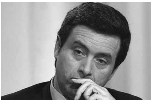
IL MINISTRO ANDREA ORLANDO E IL GOVERNATORE STEFANO CALDORO

"Dopo decenni è la prima risposta a quel drama". Questo il primo commento di Enrico Letta dopo che il Senato ha approvato lo scorso 5 febbraio in via definitiva il decreto sulla Terra dei Fuochi. Tra le misure introdotte c'è il reato di combustione illecita dei rifiuti, inoltre si prevede lo stanziamento di 50 milioni di euro per il 2014 e il 2015 per effettuare gli screening medico-sanitari sulla popolazione che risiede nell'area. "Non tutto è risolvibile con un decreto, ma questo è un punto di partenza che può consentire un percorso di riscossa", ha dichiarato il ministro dell'Ambiente Andrea Orlando. Dopo 5 giorni dal Decreto Terra dei Fuochi la Regione Campania ha approvato all'unanimità l'istituzione del Registro regionale sui tumori. Il Registro tumori pediatrico è affidato all'azienda ospedaliera Santobono-Pausilipon mentre per i tumori degli adulti è stato rafforzato il ruolo del coordinamento dell'Istituto Pascale.