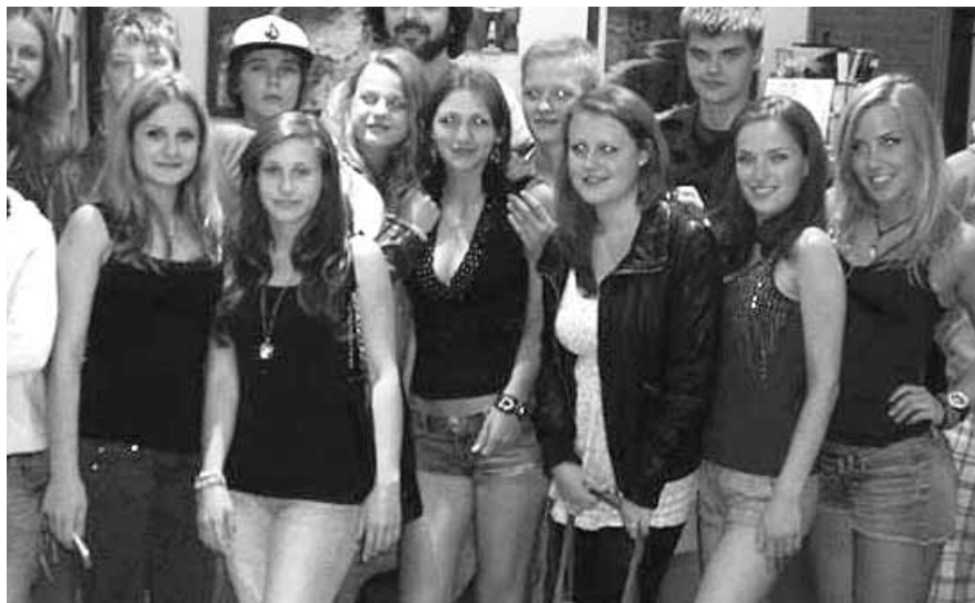
GIOVANI UNITI CONTRO LE DISCRIMINAZIONI: PUT YOURSELF IN FEMALE SHOES

25 novembre 2012, nella "Giornata Internazionale per l'eliminazione della violenza contro le donne" risuona solenne un monito, quello del Segretario Generale delle Nazioni Unite: il messaggio è rivolto a tutti i governi, affinché pongano in essere azioni concrete, quanto ai popoli, perché contribuiscano a rimuovere quella che più volte è stata definita come 'cultura della discriminazione di genere'. Dalle parole di Ban Ki-moon, dunque, ha tratto ispirazione "Put yourself in female shoes", progetto dell'associazione Arciragazzi di Portici: finanziato dalla Commissione Europea, vedrà la partecipazione di giovani rappresentanti della Lettonia e della Turchia che, unitamente ai volontari nostrani, svolgeranno svariate attività sul territorio del Comune vesuviano, dal 2 al 9 marzo 2014. Se si man-