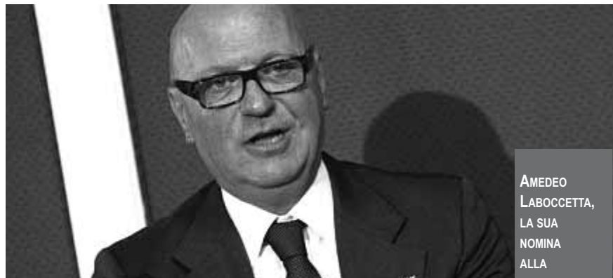
AMEDEO LABOCETTA, LA SUA NOMINA ALLA PRESIDENZA DELLA GORI SCATENATA SUBITO POLEMICHE E MALUMORI

Napoli - Amedeo Labocetta ex deputato Pdl è stato nominato presidente della Gori Spa, società che gestisce il servizio idrico integrato nell'ATO 3 Sarnese Vesuviano. La nomina di Labocetta ha scatenato enormi polemiche. Il sindaco napoletano Luigi de Magistris ha attaccato: "Nomina che rappresenta una scelta sbagliata, espressione di spartizione ed occupazione politica in un settore delicatissimo come quello dell'intero ciclo delle acque". Contro Labocetta anche lo scrittore Roberto Saviano che in tweet aveva tuonato "Labocetta, espressione della peggiore politica, nominato presidente della Gori. Vergognoso". Seccata ed ironica la replica del neo president Gori Spa: "Invito solo de Magistris a fare una doccia d'umiltà, magari con acqua Gori,