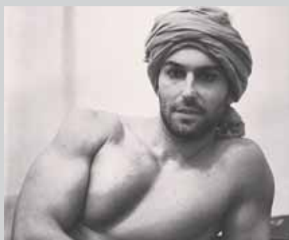
DA UOMINI E DONNE AL CINEMA E TEATRO D'AUTORE